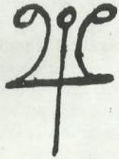
Ur nr. 220 er med romertal og dette tegn mellem tismetallene.

Det er også muligt, at man må se bort fra det mere personlige eller individuelle i udsmykningen og se den ud fra tidens kunstneriske stil rokokoen .